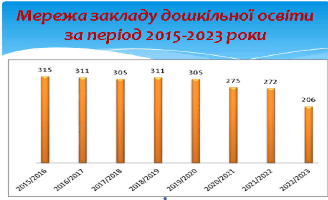
Рисунок 1. Мережа закладу за минулі роки

моніторингу кількості дітей дошкільного віку у мікрорайоні дошкільного закладу за останні роки зменшується, відповідно й зменшується мережа закладу (Слайд 6):